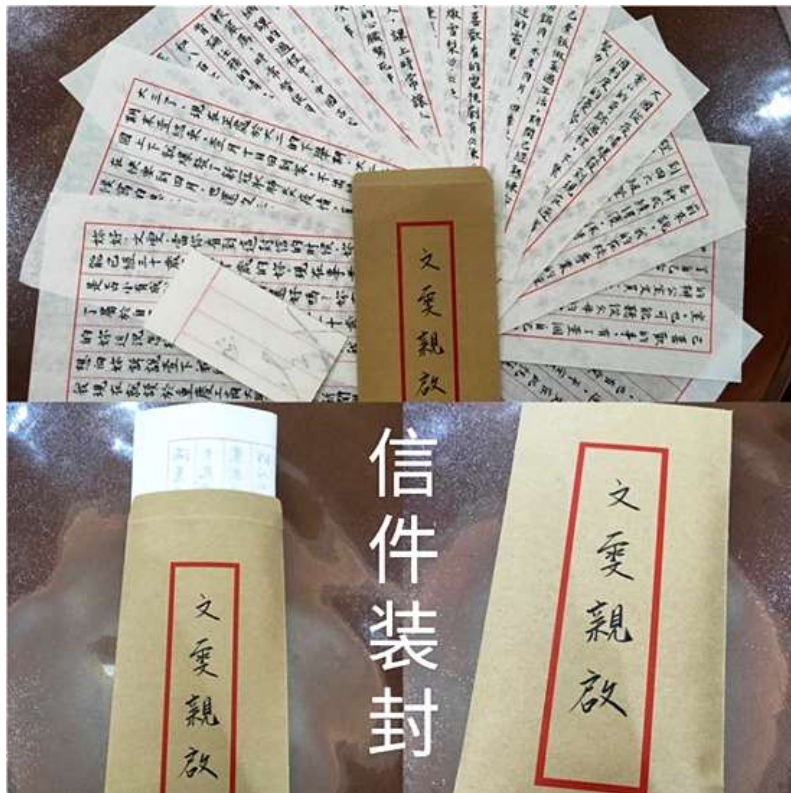
学生用书信形式写下的给未来的自己的一封信

重庆工商大学党委书记李志雄表示，学校党委一直高度重视马克思主义学院、马克思主义理论学科、思想政治理论课建设，切实采取措施提高思想政治理论课教学质量。目前，该校马克思主义学院是重庆市重点马克思主义学院，马克思主义理论学科是重庆市重点学科。重庆工商大学实施“思想政治理论课综合实践教学，是对课堂教学的进一步深化和延伸。”该校马克思主义学院院长王仕勇表示，《马克思主义基本原理概论》课程的部分教师一直坚持指导学生阅读经典文献，要求学生写读书笔记；《毛泽东思想和中国特色社会主义理论体系概论》老师坚持指导学生开展国情社情调研活动；《思想道德修养与法律基础》老师开展正能量传播活动；《中国近现代史纲要》课程的部分教师组织学生编排话剧，开展红色文化参访等活动；部分思想政治理论课教师还组织艺术学院的学生创造思想艺术作品。这些活动激发了学生对思想政治理论课的学习热情，但这些活动是零散和个别的。