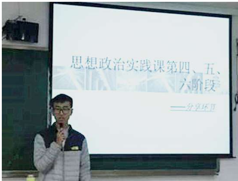
学生做思想政治实践课分享