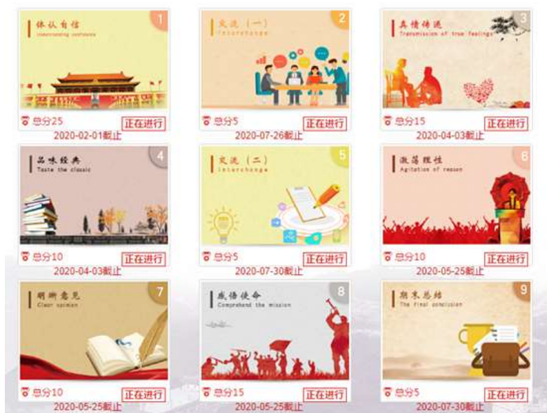
思想政治理论课综合实践教学平台

此外，为解决师生参与积极性、实践方式有效性和保障机制持续性等问题，重庆工商大学紧跟时代采取先进灵活的线上线下相结合的思政实践教学模式。通过即时通讯方式，学生在教师指导下进行课下实践，将实践成果通过网络平台进行提交，教师线上对成果进行批阅；在对应的时间节点，师生共同完成课堂总结与交流环节的模式。学生通过参与社会实践与教师的交流增多，对思想政治理论课的认同度也提升了。