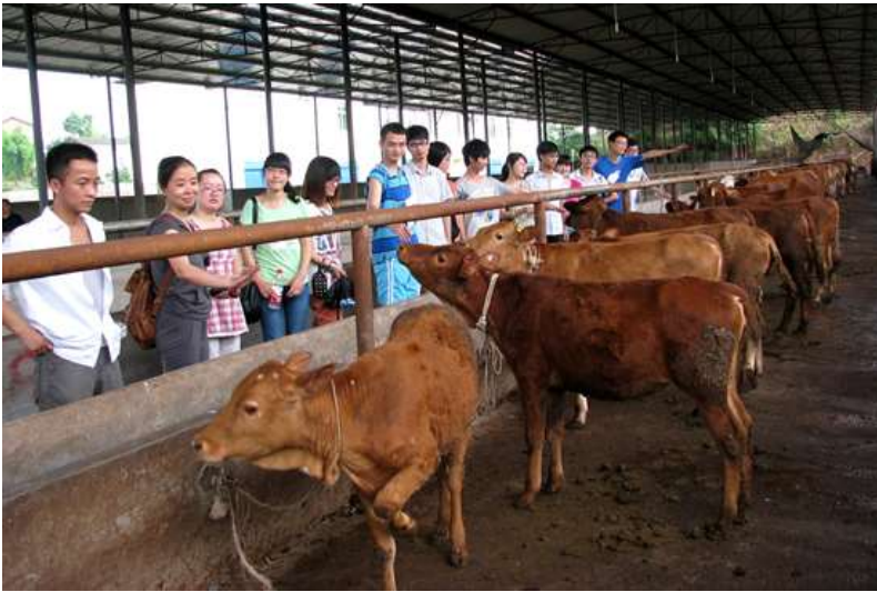
思想政治理论课实践教学指导老师带领学生在实践基地重庆垫江百家镇实践