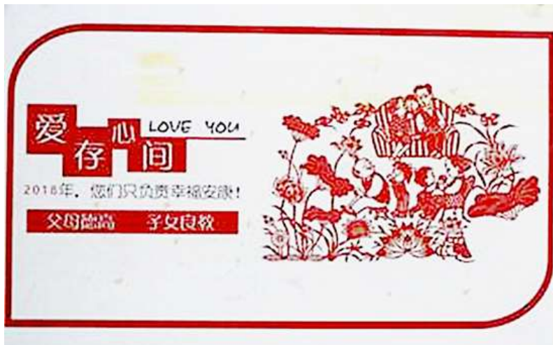
“体认自信”海报设计作品