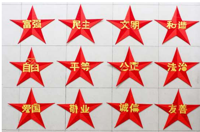
体现社会主义核心价值观的拼布刺绣获奖作品

2017年，学校通过《重庆工商大学思想政治理论课综合实践教学实施方案》，成立了思想政治理论课综合实践教学中心，让重庆工商大学思想政治理论课的实践教学迎来了发展新阶段。该校把分散在各门课程的实践教学统一起来，设置了单独的“思想政治理论课综合实践教学”公共必修课。